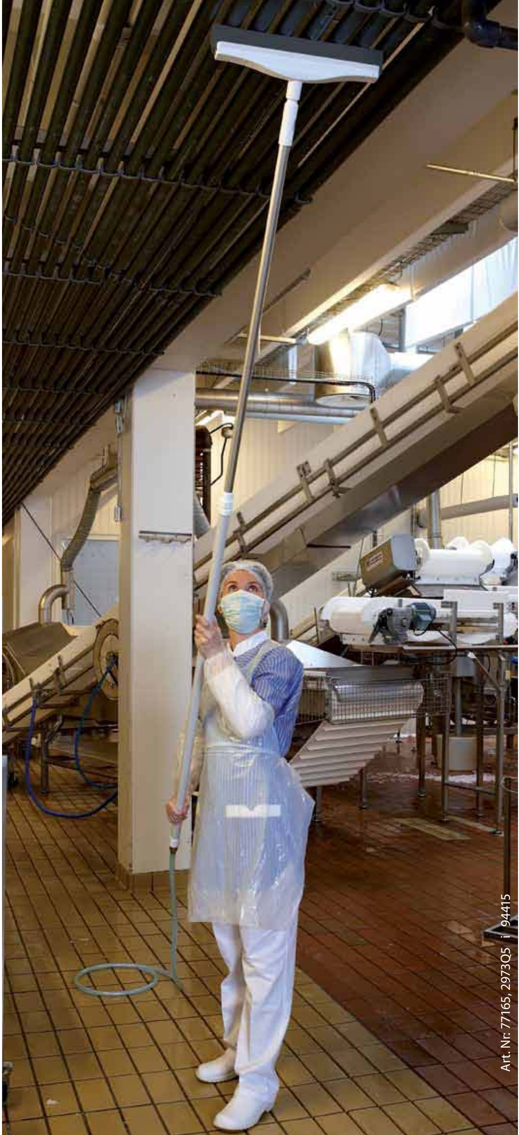
Art. Nr: 77165, 2973Q5 i 94415