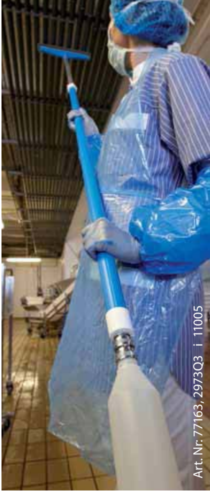
Art. Nr: 77163, 2973Q3 i 11005