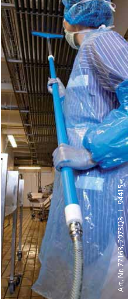
Art. Nr: 77163, 2973Q3 i 94415